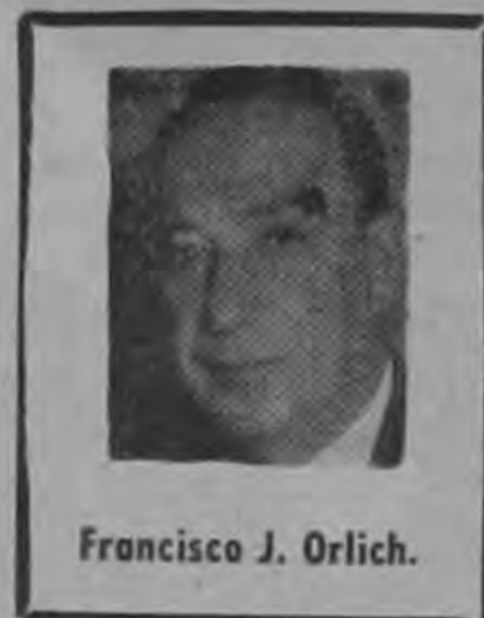
Francisco J. Orlich.

Yo me adhiero al gran partido Liberación Nacional que tiene como candidato a don Francisco J. Orlich.