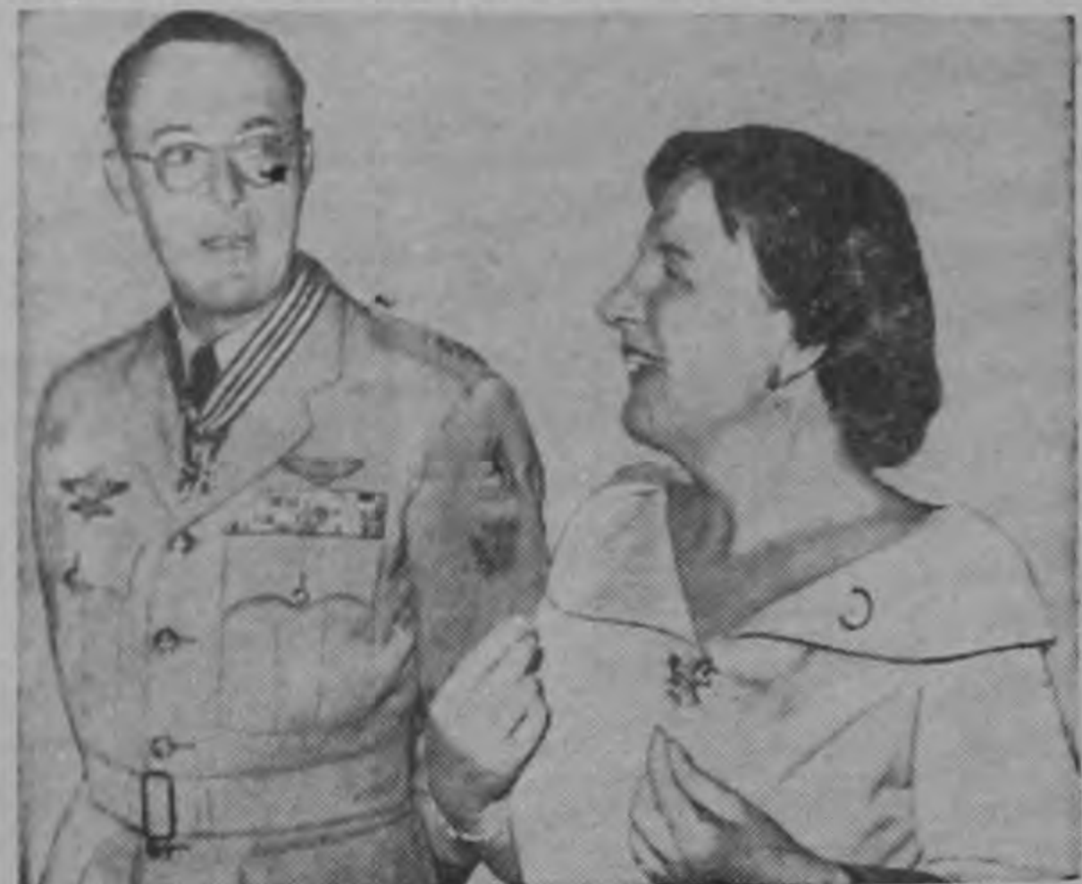
La Reina Juliana de Holanda conversando con su esposo el Príncipe Benhard en esta foto informal tomada en el palacio de Amsterdam cuando recibieron a los miembros de los Veteranos Norteamericanos de Guerras Extranjeras.