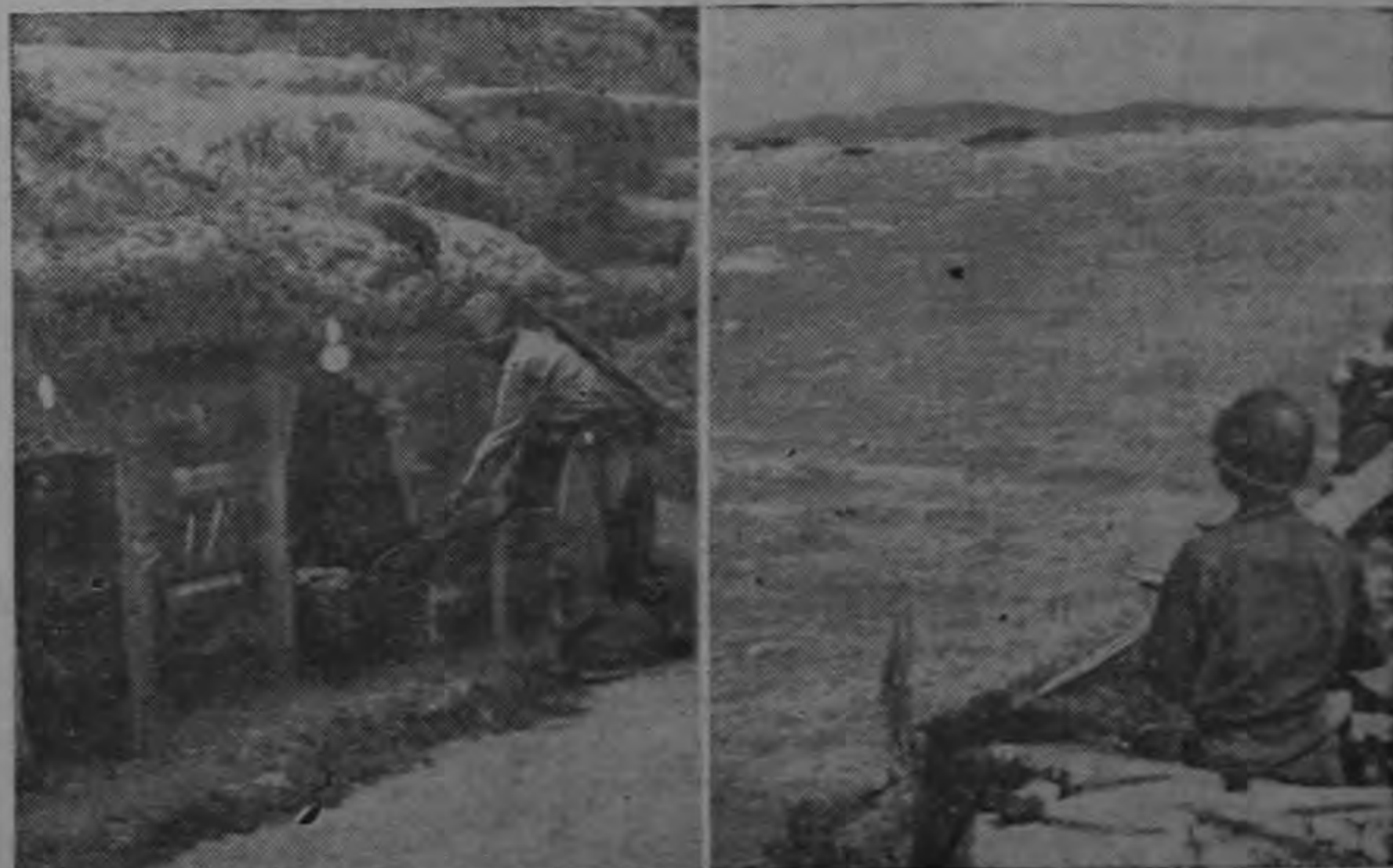
Los nacionalistas chinos mantienen una alerta día y noche como resultado de recientes ataques desde la tierra firme china a las islas costaneras próximas a Formosa. A la izquierda, cuevas naturales en la isla de Quemoy se han convertido en jefatura de un batallón. Han sido mejoradas para proteger hombres y equipos. A la derecha, un centinela de Quemoy observa la tierra firme. Al fondo se ve la isla roja de Tateng.