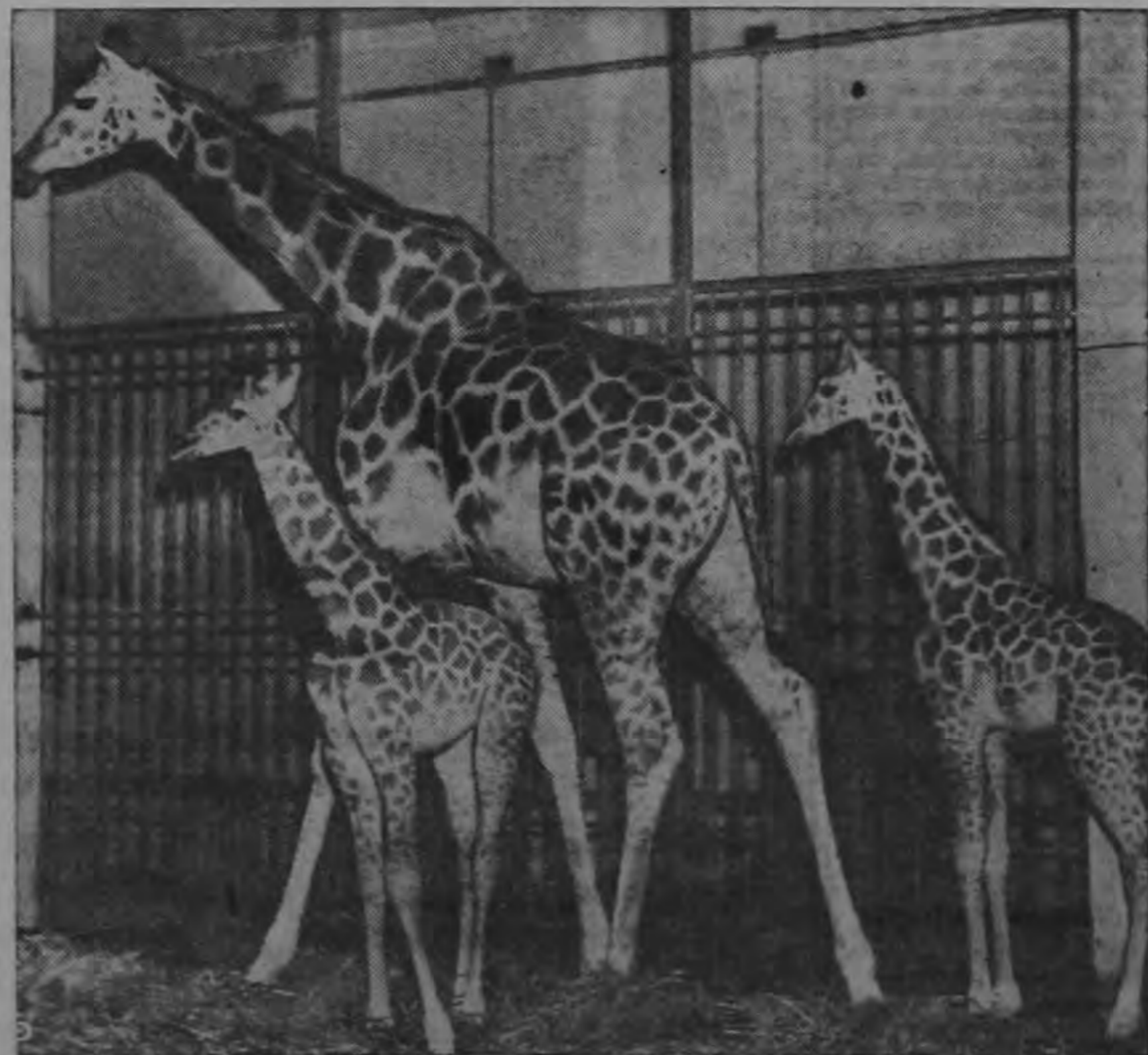
Estirando sus largos cuellos para ver mejor a los espectadores en el jardín zoológico de París, estas dos girafitas y su orgullosa mamá contemplan la escena. Las girafitas son gemelas, pero su nacimiento ocurrió con seis semanas de diferencia. Una nació a mediados de abril y la otra el 31 de mayo.